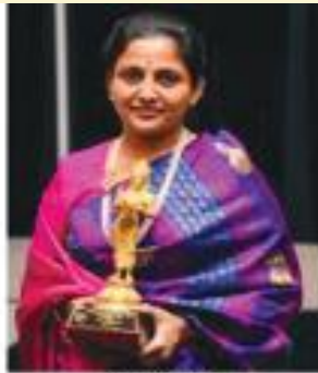
Kanimoshi Mathi Leaders for Change Award 2020