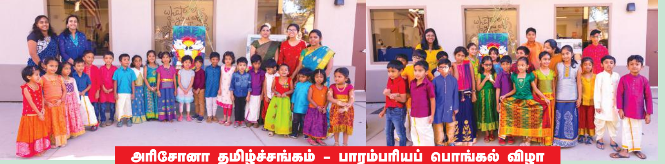
அரிசோனா தமிழ்ச்சங்கம் - பாரம்பரியப் பொங்கல் விழா

புதுமையும், அன்பும் பொங்கிடவும், மகிழ்ச்சியும் செல்வமும் தங்கிடவும், கொண்டாடப்படும் தமிழர் திருநாளாம் பொங்கல் விழா, பீனிக்ஸ் நகரில் தமிழக குழந்தைகளை முன்னிறுத்தி, தமிழ்சங்கப் பள்ளியில், தை 4 ஆம் நாள் இனிதாய் நடந்தேறியது. நமது தமிழ்ப் பாரம்பரியம் உலகம் முழுவதும் தற்போது அறியப்பட்டு, பெருமைப் படுத்தப்பட்டு வரும் வேளையில், நம் குழந்தைகளில் பலர் தமிழ்நாட்டில் நடக்கும் பொங்கல் கொண்டாட்டத்தைப் பார்த்திருக்க மாட்டார்கள் என்பதால், அவர்களுக்கென அது குறித்த விளக்கப்படங்கள் மற்றும் காட்சிகள் காட்டப்பட்டன. உழவர்களின் தோழனாகிய மாடுகளுக்கான மாட்டுப் பொங்கல் மற்றும் மஞ்சு விரட்டு (ஏறு தழுவல்) வீர விளையாட்டும் விளக்கப்பட்டது. இதன்மூலம், பொங்கல் திருநாளின் அருமையும், பெருமையும் அவர்கள் மனதில் விதைக்கப்பட்டன.